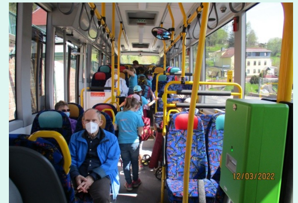
13.05. Kita. Suhl-Goldlauter zur Ringbergschule