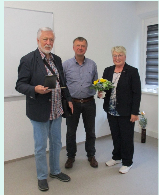
Ehrenzeichen der Deutschen Verkehrswacht in Gold