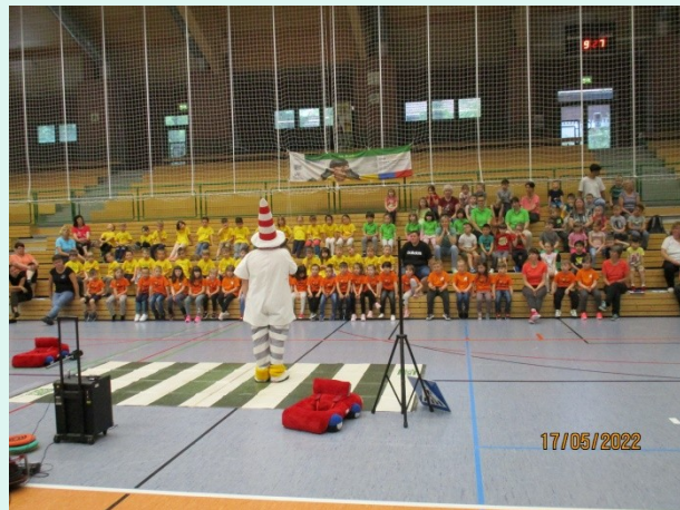
17.05. Wolfgrube Suhl mit 7 Kita