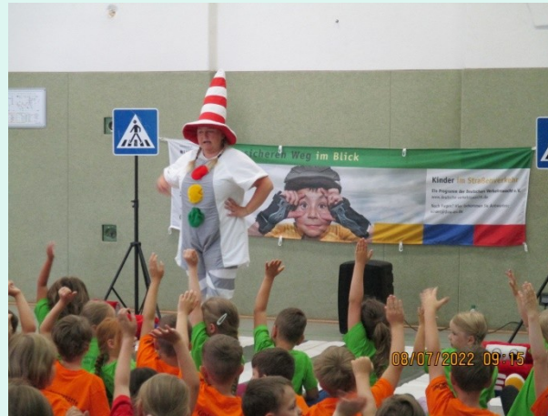
08.07. Mehrzweckhalle Viernau mit 7 Kita