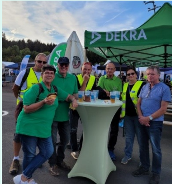
Helfer beim Firmenlauf