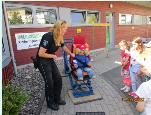
19.05. Kita. Kinderland Suhl mit 4 Kita