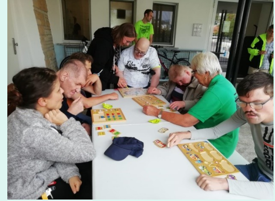
06. + 07.09. Rehasentrum DOMINO