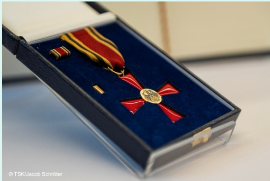
Verdienstkreuz am Bande des Verdienstordens der Bundesrepublik Deutschland