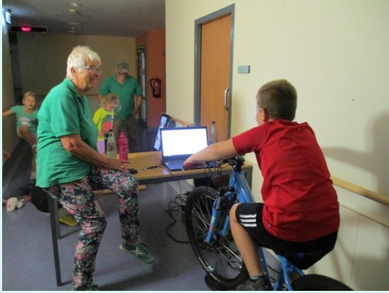
28.07. + 11.08. SRH Klinikum Suhl zur Ferienbetreuung