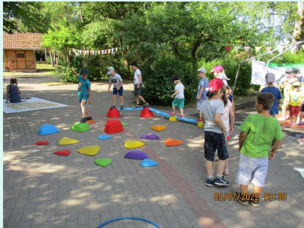
05.07. Kita. Fröbel Suhl mit 3 Kita