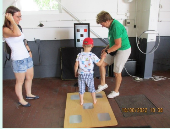
18.06. Tag der offenen Tür im Car & Bike Center Suhl